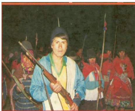
Image 1. These are the indigenous ronderos, armed with sticks, old rifles, etc. Copped image of the book cover of the Book of Iván Degregori, Las Rondas Campesinas y la derrota de Sendero Luminoso .